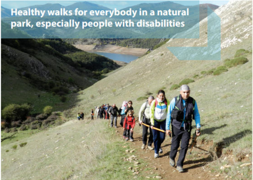
Healthy walks for everybody in a natural park, especially people with disabilities

NATURAL PARK FUENTES CARRIONAS Y FUENTE COBRE-MONTAÑA PALENTINA PROVINCE OF PALENCIA, CASTILLA Y LEÓN SPAIN